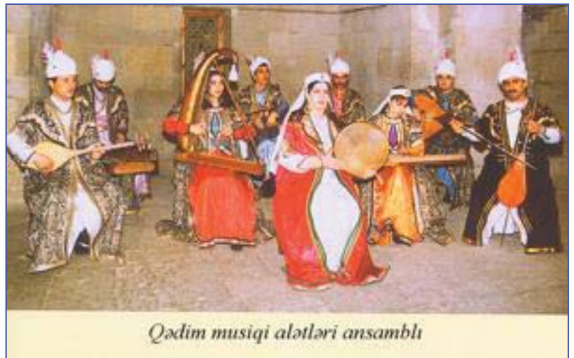
Qədim musiqi alətləri ansambli

XVII, XVIII, XIX əsrlərdə Azərbaycanda mövcud olmuş musiqi alətləri barədə məlumatı Adam Olearinin, Engelbert Kempferin, Aleksandr Dümanın, Övliyə Çələbinin və başqalarının yol qeydləri və xatirələrindən əldə etmək olar.